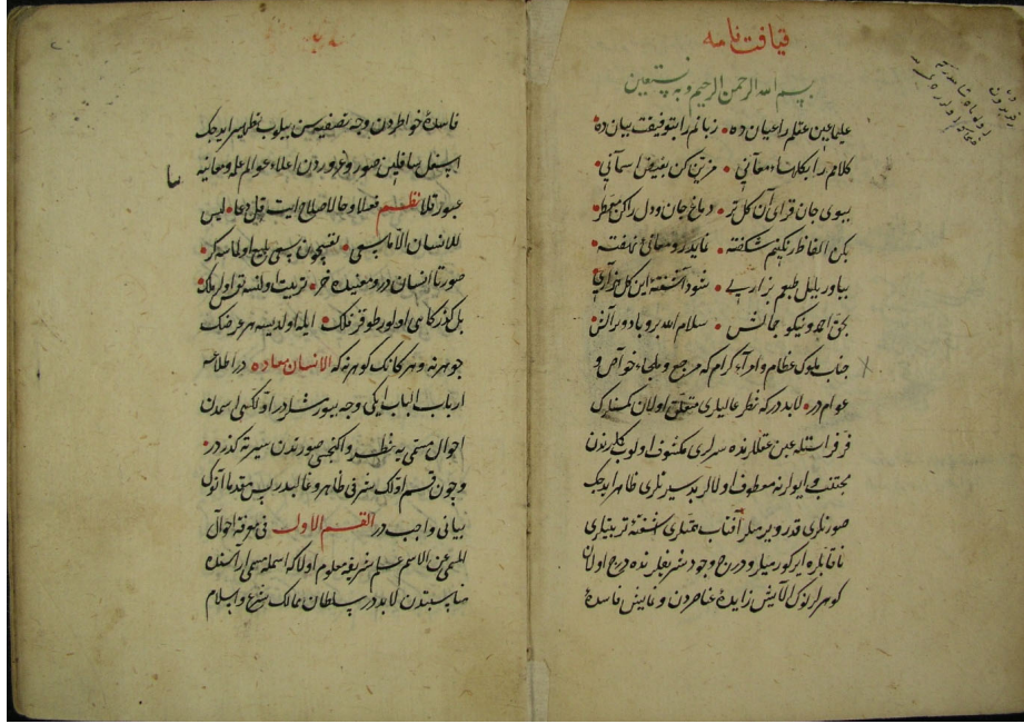
Şekil 1: Kıyafetname Birinci ve İkinci Sayfa

kullanılmamıştır. Az sayıda bazı kelimelerde okumada kolaylık ve doğruluk sağlanması için hareke kullanılmıştır.