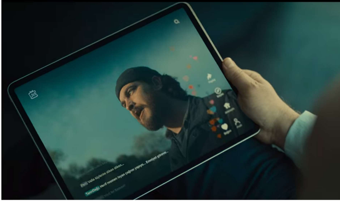
Grsel 3: İnternet baęımlılıęı