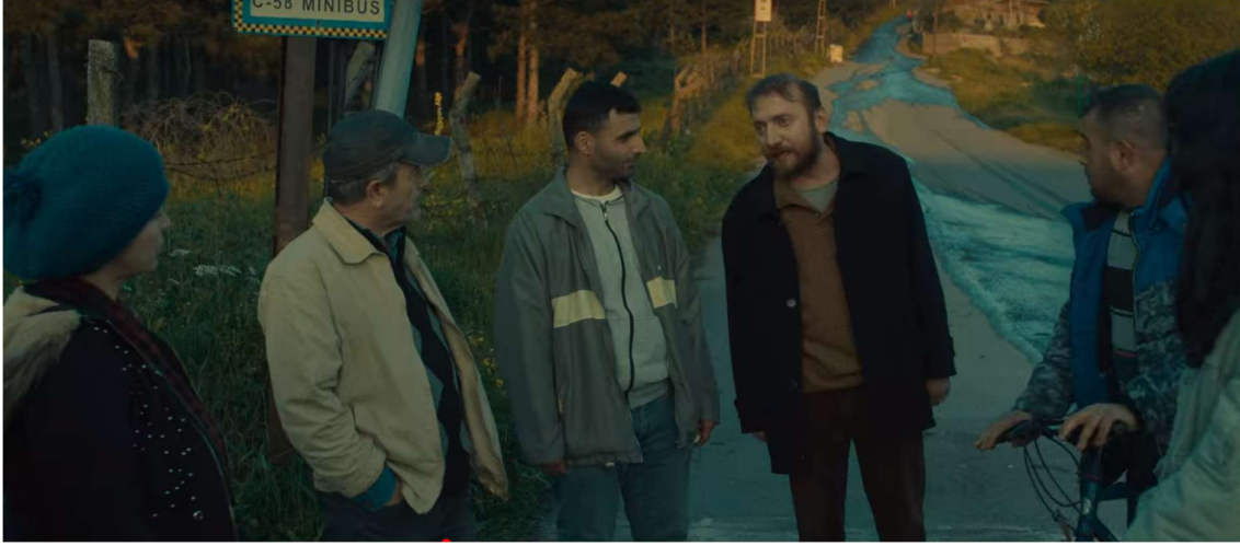
Görsel 8: Salih'in ikna çabaları