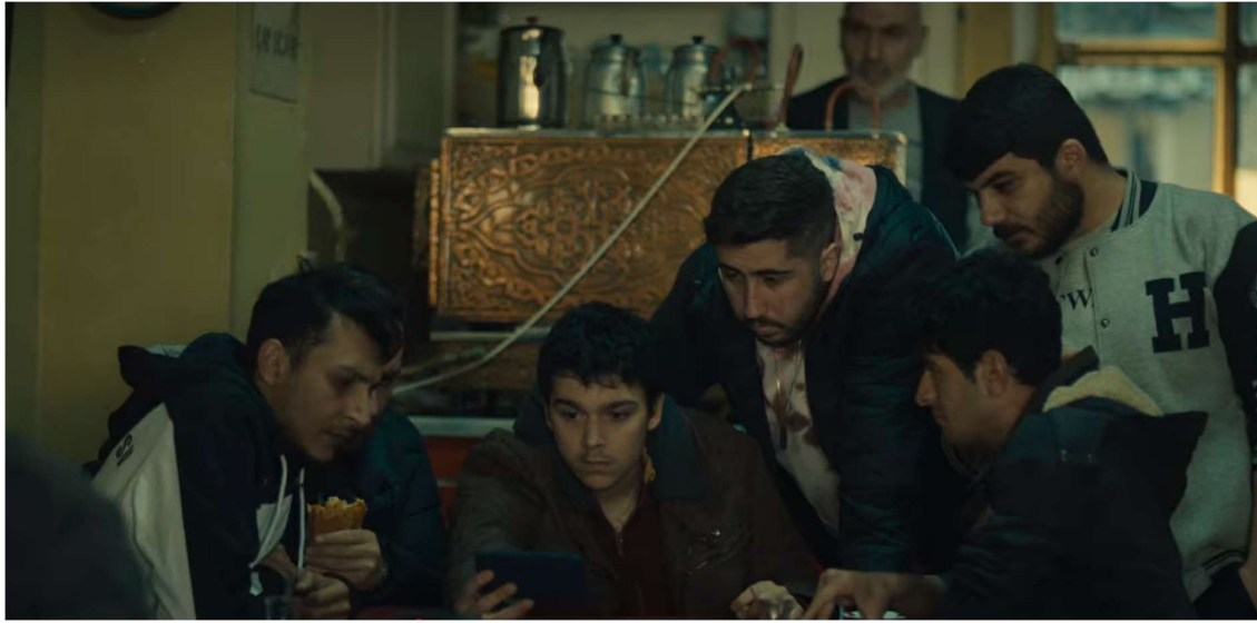
Görsel 2: Telefon bağımlılığı

Teknolojinin insanın uzantısı olduğu iddiasında bulunan McLuhan zamanla insanoğlunun “kendi makinesinin yarattığı” haline geleceğini söyler. Bu bağlamda dizinin birçok sahnesinde birçok kişinin elinde cep telefonlarının olması ve Gökhan’ın da insanlara internet üzerinden telefonlarla sesini duyurması dikkat çekmektedir. Aynı zamanda Gökhan’ın telefona “Gökhan’ın iradesi dışında” SoulTouch isimli programın yüklenmesi ve zamanla bu programdan gelen emirlere Gökhan’ın tabi olması, insanoğlunun “kendi makinesinin yarattığı” haline geldiğinin bir göstergesidir. Dolayısıyla hem Gökhan hem de ona tabi olanların aslında bedenlerinin bir uzantısı hükmünde olan teknolojiye teslim olmaları söz konusudur. Görsel 2 ve 3’te bireylerin sürekli olarak teknoloji ile iç içe olduğu görülmektedir. Genel olarak dizinin birçok sahnesinde telefon ve diğer teknolojik cihazlar, insan bedeninin uzantısı teorisini gerçek kılmaktadır.