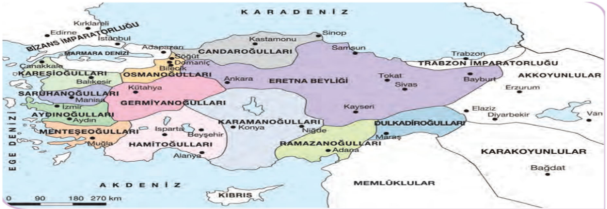
Şekil 5. Harita 1.5: XIV. Yüzyıl Başlarında Anadolu'da Kurulan Türk Beylikleri

10. Sınıf tarih ders kitabının 37. Sayfasında, 1. Ünite içerisinde "Anadolu'da Moğol Tehlikesi" alt başlığında yer alan etkinlik kısmında Şekil 4. Harita 1.4'te X-XIII. yüzyıllarda Moğol İmparatorluğu'nun sınırları gösterilmektedir. Etkinlik içerisinde anlatılan konu, Cengiz Han tarafından Moğol İmparatorluğu'nun kurulduğu, Harezm bölgesinin büyük bir kısmını ele geçirdiği, bir süre sonra da tüm Kafkasya, Rusya ve Anadolu'ya Moğolların hâkim olduğundan söz edilmektedir. Şekil 4. Harita 1.4., Şekil 5. Harita 1.5.'teki konuyu somutlaştırmak adına verilmiştir. Şekil 4. Harita 1.4.'te yön işareti kullanılmamıştır.