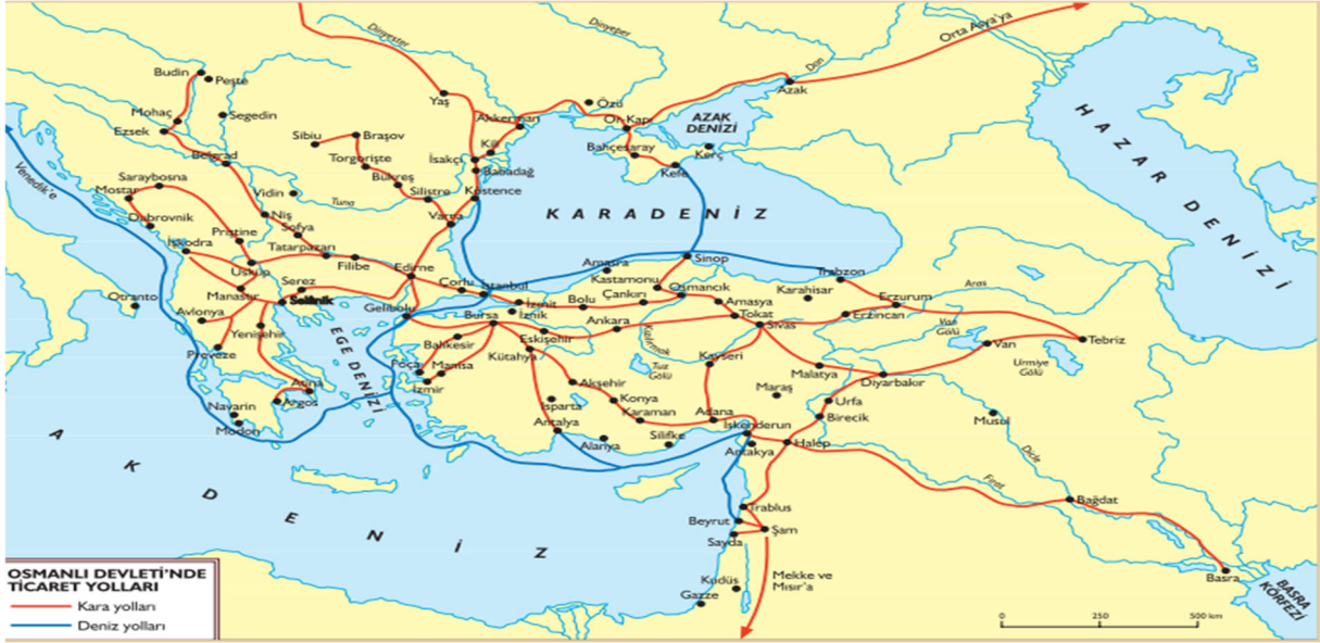
Şekil 15. Harita 5.6: Osmanlı Ticaret Yolları

10. Sınıf tarih ders kitabının 124. sayfasında, 5. Ünite içerisinde “1520-1595 Yılları Arası Osmanlı Siyasi Faaliyetleri” alt başlığında yer alan şekil 14 harita 5.5’te, 1520-1595 yılları arasında Osmanlı siyasi faaliyetlerini göstermektedir. Kronolojik olarak, siyasi olaylar harita üzerinde somutlaştırmak istenmiştir. Konu başlığı içerisindeki tarih aralığında verilen gelişmelerden biri olan, I. Viyana Kuşatması (1529) harita üzerinde gösterilmemektedir. Yine belirtilen tarih aralığı içerisinde gerçekleşen Yemen’in Fethi (1568) harita üzerinde gösterilmemiş olan siyasi gelişmelerden bir diğeridir. Bu durum konu anlatımı ile haritanın tam olarak uyummadığını göstermektedir. Haritada yön işareti kullanılmamıştır.