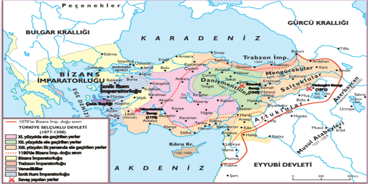
Şekil 1. Harita 1.1: 1071-1308 Yılları Arasında Anadolu'nun Genel Durumu

İlke Yayınevi Tarafından Yayımlanan 10. Sınıf Tarih Ders Kitabında Yer Alan Haritaların Görsellikleri ve Konuyla İlişkisi