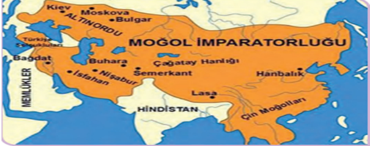
Şekil 4. Harita 1.4: Türk-Moğol Mücadelesi

başlığında yer alan haritada, Haçlı Seferleri gösterilmiştir. Şekil 3. Harita 1.3'te lejant kısmında Haçlı Seferlerinin yol güzergahları renkli verilmiştir. 3. Haçlı Seferi ve 6. Haçlı Seferi yol güzergahlarının her biri yeşil renktedir. Bu durum harita üzerinde belirtilen seferlerden hangisinin 3. Haçlı Seferi hangisinin 6. Haçlı Seferi olduğunu anlamayı zorlaştırmaktadır. Yol varyantlarının gösterildiği haritalarda kullanılan renklerin hepsinin birbirinden farklı renkte olması gerekmektedir. Konu anlatım kısmında yer alan Bizans İmparatorluğu ve Türkiye Selçuklu Devleti'nin siyasi sınırları Şekil 3. Harita 1.3'te belirtilmemiştir. Bu devletlerin siyasi sınırları harita üzerinde gösterilmesi uygun olurdu. Ayrıca haritada yön işareti de kullanılmamıştır.