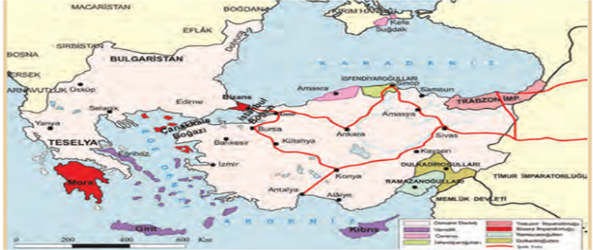
Şekil 11. Harita 5.2: Feth-i Mübin

Osmanlı Devlet'inin bahsi geçen dönemdeki doğu sınır komşuları harita üzerinde gösterilmemektedir. Gösterilen tarih aralığında siyasi olayların fazla olması, ilk bakışta kronolojik olarak siyasi süreçlerin değerlendirilmesini zorlaştırmaktadır. Haritada yön işareti kullanılmamıştır.