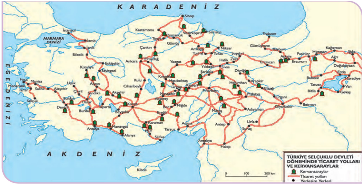
Şekil 2. Harita 1.2: Türkiye Selçuklu Dönemi'nde Anadolu'daki Ticaret Yolları

10. Sınıf tarih ders kitabının 28. sayfasında, 1. Ünite içerisinde “ Ekonomik Hayat ” alt başlığında yer alan haritada, Anadolu Selçuklu Devleti döneminde ticaret yolları, yerleşim yerleri ve kervansarayları gösterilmiştir. Kervansaray olarak belirlenen şekillerin haritanın sağ alt köşesinde yeşil renkli gösterildiği, yerleşim yerlerinin ise siyah nokta ile gösterildiği görülmektedir. Bu ticaret yollarının hepsi kırmızı renk ile gösterilmiş olup yolların önem derecesi gösterilmemiştir. Ana ticaret yolları ve ikinci derecedeki ticaret yollarının gösterilmesi haritayı daha anlaşılır hale getirebilirdi. Ayrıca ticaret yollarının oluşmasında coğrafi etkenleri de açıklayabilmek adına bu harita, fiziki özellikleri de gösteren bir harita olsaydı konunun aktarılmasını daha da kolaylaştırabilirdi. Ayrıca haritada yön işareti de bulunmamaktadır.