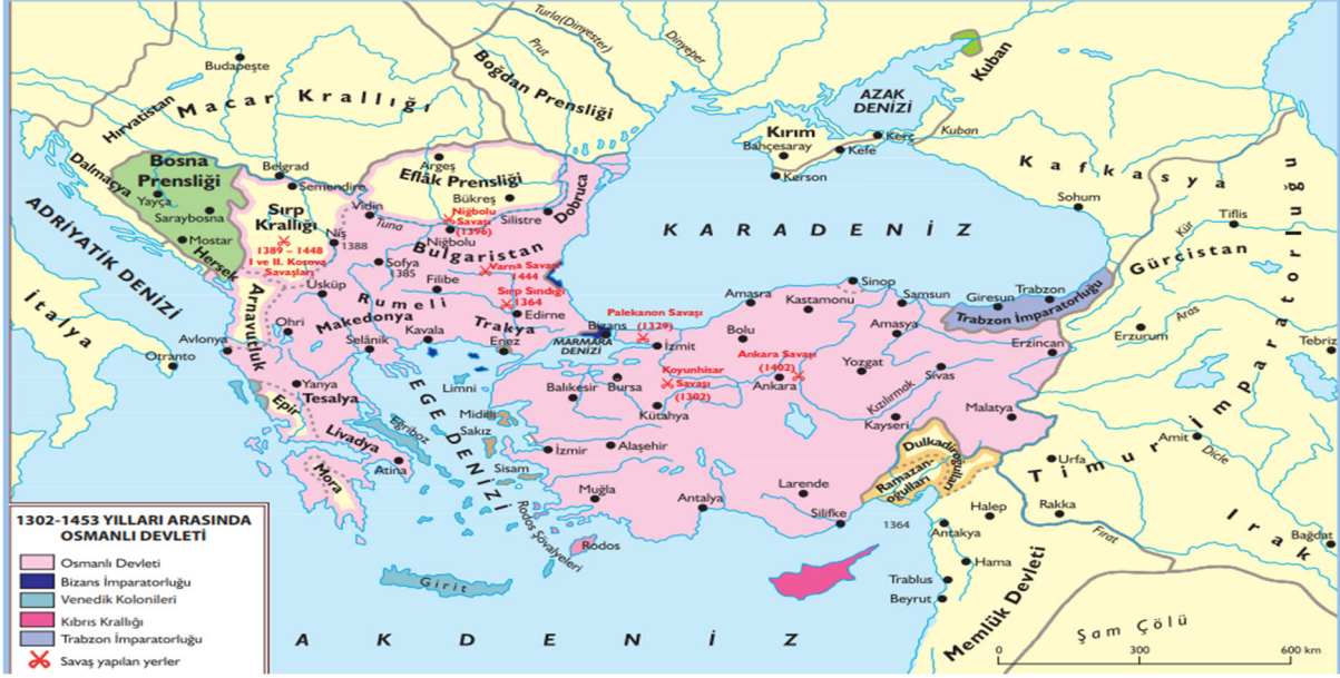
Şekil 6. Harita 2.1: 1302-1453 Yılları Arasında Osmanlı Devleti

Siyasi ve Toplumsal Durumu ” alt başlığında yer alan haritada, XIV. yüzyıl başlarında Anadolu’da kurulan Türk Beylikleri (İkinci Beylikler) gösterilmektedir. Fakat Anadolu Selçuklu Devleti’nin yıkılmasından sonra kurulan bazı beyliklere (Canikoğulları, Tekeoğulları vb.) metinde ve Şekil 5. Harita 1.5’te yer verilmemiştir. Ayrıca lejant ve yön işareti de kullanılmamıştır.