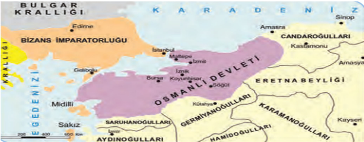
Şekil 7. Harita 2.2: 1345’te Osmanlı Devleti Sınırları

10. Sınıf tarih kitabının 46. sayfasında, 2. Ünite olan “ Beylikten Devlete Osmanlı Siyaseti (1302-1453) ” içerisinde “ Aşiretten Beyliğe ” alt başlığında yer alan Şekil 6. Harita 2.1’de, 1302-1453 yılları arasında Osmanlı Devleti’nin sınırları gösterilmektedir. Osmanlı Devleti’nin batı ve doğudaki sınır komşuları harita üzerinde gösterilmiş ve lejant ile desteklenmiştir. Tarih aralığı uzun bir dönemi kapsadığı için kronolojik olarak haritayı yorumlamak zorlaşmaktadır. Konu anlatım kısmında yer alan siyasi gelişmelerde Çirmen Muharebesi’ne (1371) yer verilmiştir. Ancak konu anlatım kısmında yer verilmiş olmasına rağmen Çirmen Muharebesi (1371) ilgili harita üzerinde gösterilmemiştir. Haritada yön işareti kullanılmamıştır.