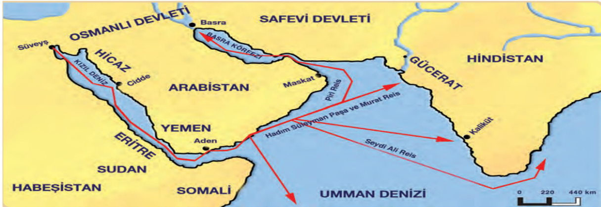
Şekil 17. Harita 5.8: Osmanlı Devleti’nin Düzenlediği Hint Deniz Seferleri

10. Sınıf tarih kitabının 140. sayfasında, 5. Ünite içerisinde “Coğrafi Keşifler ve Osmanlı Devleti’ne Etkileri” alt başlığında yer alan Şekil 16. Harita 5.7’de, Coğrafi Keşifler’i göstermektedir. Avrupalı keşiflerin, seyahatleri harita üzerinde gösterilmiştir. Lejantta, hangi kâşifin nereleri keşfettiği görülebilmesi adına farklı renkler kullanılmaya çalışılmışsa da Bartolomeo Diaz (Bartelmi Diaz) ve Christopher Columbus (Kristof Kolomb)’un keşfettiği yerler aynı renk (turuncu) ile gösterilmiştir. Aynı şekilde America Vespucci (Amerika Vespuçi) ve Cartier (Kartier) ’in seyahatleri de aynı renk (kırmızı) ile gösterilmiştir. Lejantta ve haritada farklı keşifler için aynı renklerin kullanılması haritayı doğru okuyabilmeyi güçleştirmektedir. Haritada ölçek ve yön işareti kullanılmamıştır.