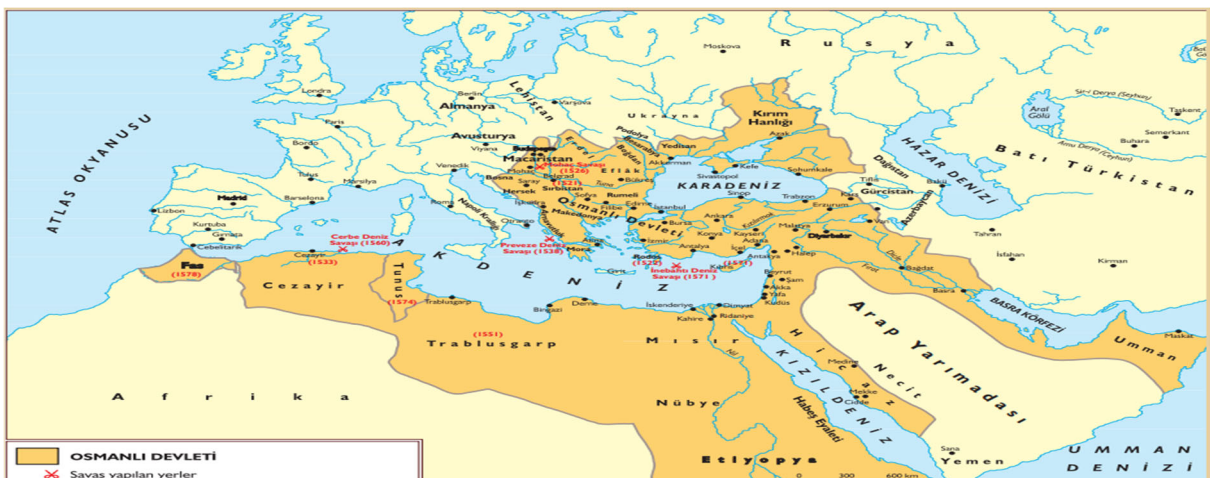
Şekil 14. Harita 5.5: 1520-1595 Yılları Arası Osmanlı Siyasi Faaliyetleri

10. Sınıf tarih ders kitabınının 123. sayfasında, 5. Ünite içerisinde "Osmanlı Memlûk İlişkileri" alt başlığında yer alan Şekil 13. Harita 5.4'te, 1520 yılında Osmanlı sınırları gösterilmekte olup Yavuz Sultan Selim dönemi siyasi olayları verilmeye çalışılmıştır. Konu anlatım kısmında, Osmanlı Devleti'nin Mısır'da kurulan Memlûk Devleti ile yaptığı Mercidabık Savaşı (1516) ve Ridaniye Savaşı (1517) anlatılmıştır. Haritada lejant kısmında savaş yapılan yerler siyah renk ile gösterilmiştir. Fakat haritada savaş yapılan yerler kırmızı renk ile gösterilmiştir. Haritada Osmanlı Devleti'nin sınır komşularının adlarına yer verilmemiş ve bu devletlerin siyasi sınırları haritada gösterilmemiştir. Haritada yön işareti kullanılmamıştır.