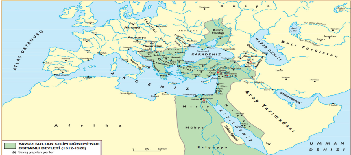
Şekil 13. Harita 5.4: 1520'de Osmanlı Sınırları

anlatım kısmında Fatih Sultan Mehmet'in İstanbul'u Fethi için yapmış olduğu hazırlıklardan söz edilmekte ve Rumeli Hisarı'nı (Boğazkesen) yaptırdığı anlatılmaktadır. II.Mehmet'in hem Bizans'a Karadeniz'den gelebilecek yardımları engellemek hem de Türk askerlerinin Rumeli'ye geçişini kolaylaştırmak istediği ifade edilmekte ve öğrenciler ilgili haritaya yönlendirilmektedir. Fakat ilgili haritada Rumeli Hisarı gösterilmemiştir. İlgili planda lejant ve ölçek kullanılmış, yön işareti ise kullanılmamıştır.