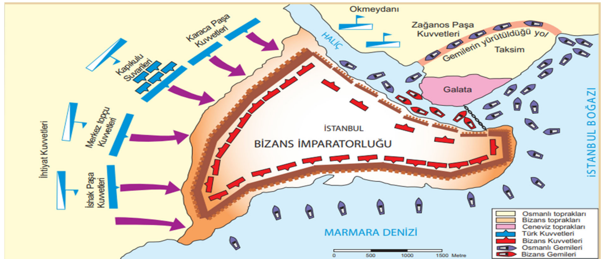
Şekil 12. Harita 5.3: İstanbul’u Kuşatma Planı

10. Sınıf tarih ders kitabının 117. sayfasında, 5. Ünite içerisinde yer alan “İstanbul’un Fethi ve Sonuçları” alt başlığında yer alan şekil 11. harita 5.2’de, “Feth-i Mübin” etkinliği içerisinde yer almakta olup 1452 yıllarında Osmanlı sınırlarını göstermektedir. Etkinlik içerisinde Osmanlı Devleti’nin ticaret yollarını geliştirmek amacıyla İstanbul’un alınmasının zorunlu duruma gelmesi, Bizans’ın Osmanlı’nın toprak bütünlüğünü bozması ve Bizans’ın Osman Devleti’ne tehdit oluşturduğu anlatılmaktadır. Harita İstanbul’un Fethi’nin jeopolitik açıdan değerlendirilmesi konusunda yardımcı olmaktadır. Haritada yön işareti kullanılmamıştır.