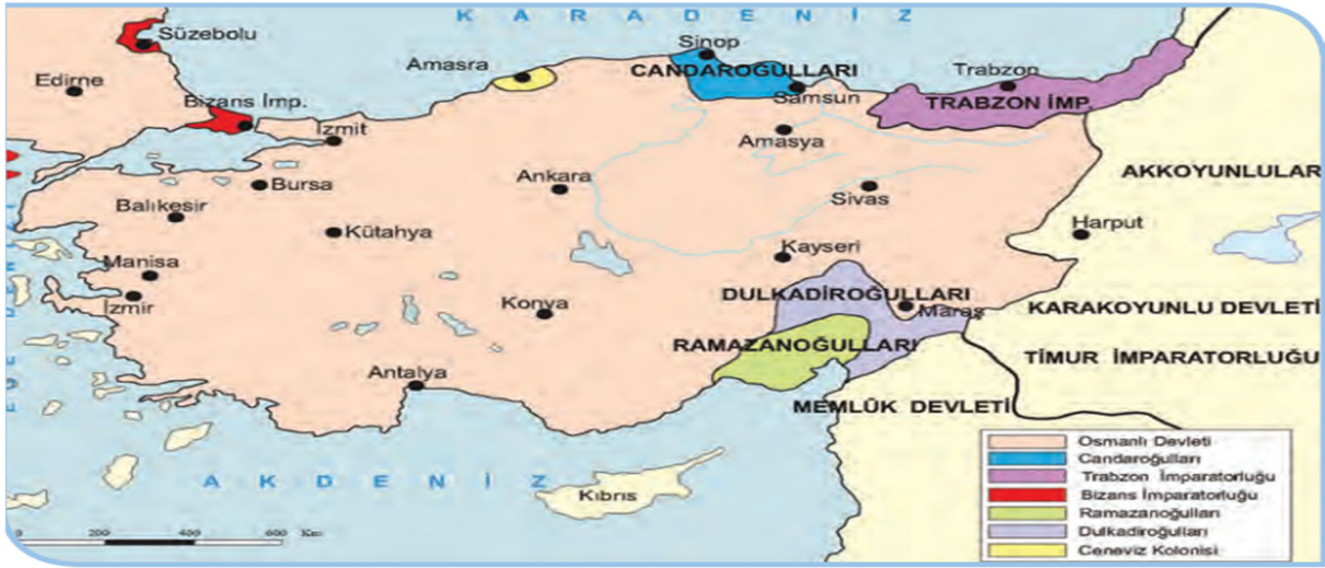
Şekil 8. Harita 2.3: Yıldırım Bayezid Dönemi’nde Osmanlı Devleti’nin Anadolu Sınırları

10. Sınıf tarih kitabının 55. Sayfasında, 2. Ünite içerisinde “Osmanlı- Bizans İlişkileri” alt başlığında yer alan haritada, Orhan Bey döneminde yapılan siyasi gelişmeler metin içerisinde aktarılmıştır. Bursa’nın fethedilmesiyle beraber başkent oluşu, Kocaeli Yarımadası’nın fethedilmesi, İstanbul Boğazı’na doğru ilerleyiş ve İznik tekfuru ile yapılan Palekanon Savaşı’ndan (1329) söz edilmiştir. Palekanon Savaşı’na konu anlatım kısmında yer verilmiş olmasına rağmen, harita üzerinde Palekanon Savaşı’nın yeri gösterilmemiştir. Osmanlı Devleti’nin doğu, batı ve güney komşularının belirtilmesinde yön işareti önemli olmasına rağmen haritada kullanılmadığı görülmüştür. Haritada lejant da kullanılmamıştır.